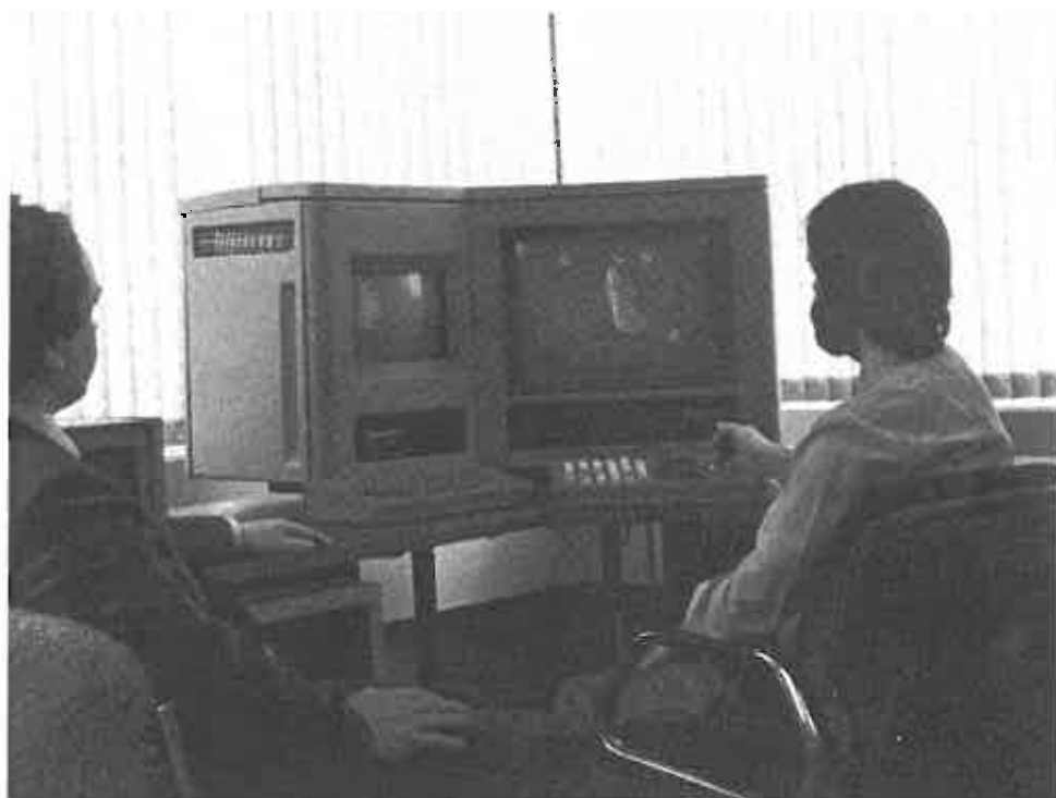
Viele Menschen sind bei der technologischen Entwicklung „Täter“ und später Ihre eigenen „Opfer“

Die These von der sozialen Gestaltbarkeit der technologischen Entwicklung führt unweigerlich zu der Frage, welche Akteure und welche Prozesse denn diese Veränderungen prägen und welche Trends sich abzeichnen. Hier lassen sich zunächst drei Zentren ausmachen: Die Unternehmen , die