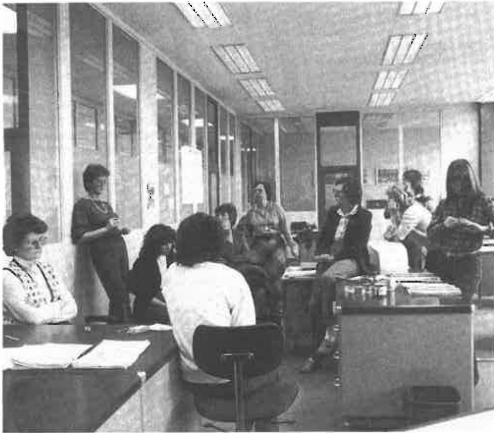
Die humane und ökologische Gestaltung kann durch den Dialog mit den Betroffenen entwickelt werden. Sie muß breit diskutiert und unter Mobilisierung von Mehrheiten umgesetzt werden. Ein wesentlicher Ansatzpunkt: der Betrieb.

blick werden, in dem die Gewerkschaften schon aus Überlebensinteressen eine Hauptrolle spielen müssen. Mit den beschäftigungspolitischen Vorschlägen und dem Programm „Umweltschutz und qualitatives Wachstum“ des DGB, dem Programm „Arbeit und Technik“ der IG Metall und dem Konzept „Bauen und Umwelt“ der Gewerkschaft Bau-Steine-Erden haben die Gewerkschaften beachtenswerte programmatische Perspektiven vorgelegt und zugleich erste Umsetzungsschritte angegeben. Die Stellungnahme „Arbeit und Technik“ des DGB beinhaltet eine ausführliche Darstellung der „Vorschläge des DGB zur sozialen Steuerung des technischen Wandels“.