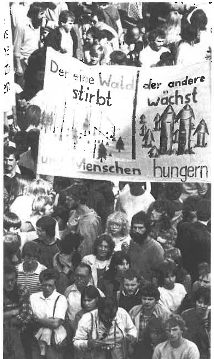
Die kritische Sicht der Hochrüstung, der Kernenergienutzung und der Umweltprobleme können auch den Rahmen für eine stärkere kritische Bewegung in der Bundesrepublik bilden

dere diese für die Produktion besonders wichtigen Mitarbeiter in das Unternehmenskonzept einzubinden (z. B. über Qualitätszirkel). Zugleich werden die Betriebe aber auch stör anfälliger: Schon kleinere Fehler von Arbeitnehmern (oder gar gezielte Sabotageakte, über die schon berichtet wurde) können ganze Produktionsprozesse lahmlegen, und die verstärkten Möglichkeiten der Selbstverwirklichung in der Arbeit können bei den Belegschaften ein Selbstbewußt-